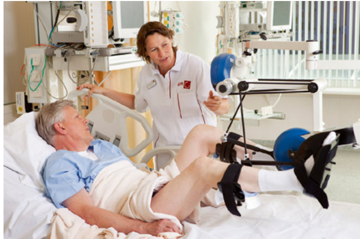
Figuur 2 Gebruik van de bedfiets bij een intensiecarepatiënt.

uithoudingsvermogen, minder spierkracht en verminderde beweeglijkheid van de gewrichten. Eén jaar na ontslag heeft circa de helft van de patiënten die meer dan twee dagen op de IC is behandeld en beademd nog lichamelijke beperkingen in het dagelijks functioneren. Ook na vijf jaar kunnen er nog lichamelijke klachten zijn ten gevolge van de IC-opname en kritieke ziekte. 3 Het meest in het oog springende beeld is IC verworven spierzwakte (ICU acquired weakness). Naar schatting heeft circa 50% van de IC-patiënten met sepsis, multi-orgaanfalen of langdurige sedatie en beademing, IC verworven spierzwakte. Deze spierzwakte ontstaat op de IC en treft zowel de ledematen als de ademhalingspijpen en leidt tot een vertraagde revalidatie na ontslag. Pathofysiologisch is er bij patiënten met IC verworven spierzwakte sprake van een complexe functionele en structurele verandering van de zenuw (axonale degeneratie) en spier (atrofie).